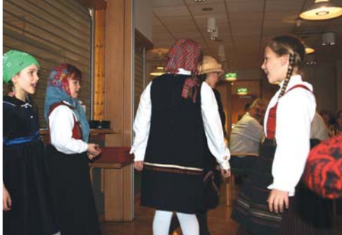
Unge underholdere med gamle sangleker.