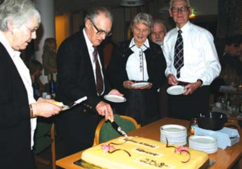
Jubileumskaken hadde betydelig format.