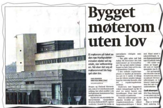
Faksimile fra BT 6. juni 2005.